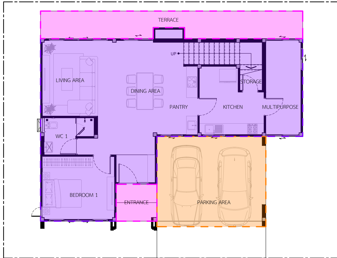
แปลนพื้นที่ 1 มาตรฐาน 1 : 100