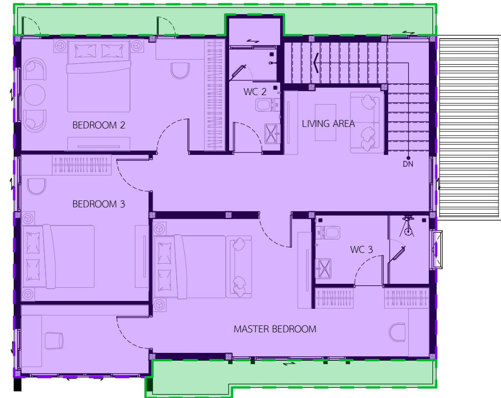
แปลนพื้นที่ 2 มาตรฐาน 1 : 100